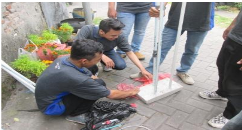
Gambar 1b. Perencanaan pembuatan tanaman vertikultur