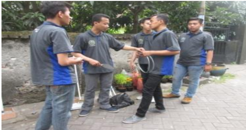
Gambar 1a. Perencanaan dan pengambilan bahan untuk pembuatan tanaman vertikultur