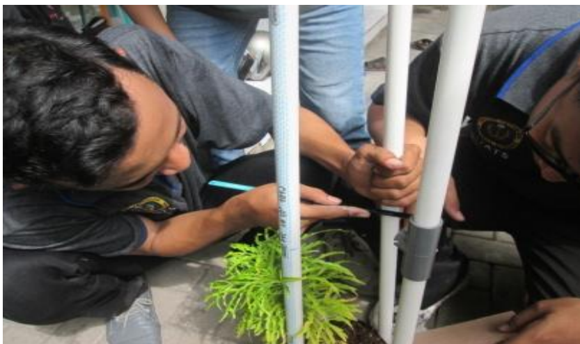
Gambar 1c. Pembuatan tanaman vertikultur