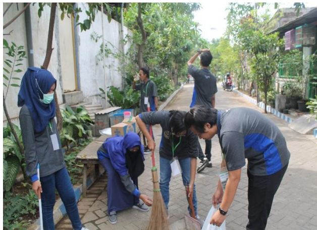
pembersihan lingkungan rumah (Hari jum'at: 14/07/2017)