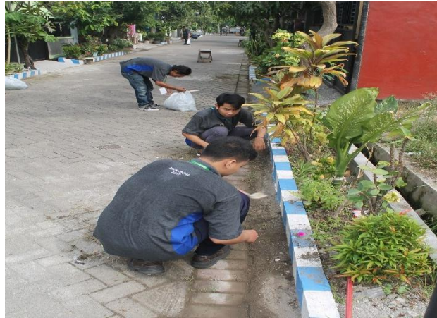
pembersihan taman (Hari jum'at: 14/07/2017)