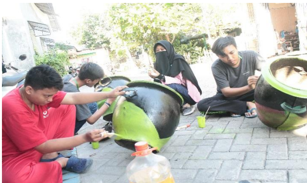
Pengecatan tong sampah (tahap 1) (Hari Sabtu: 15/07/2017)