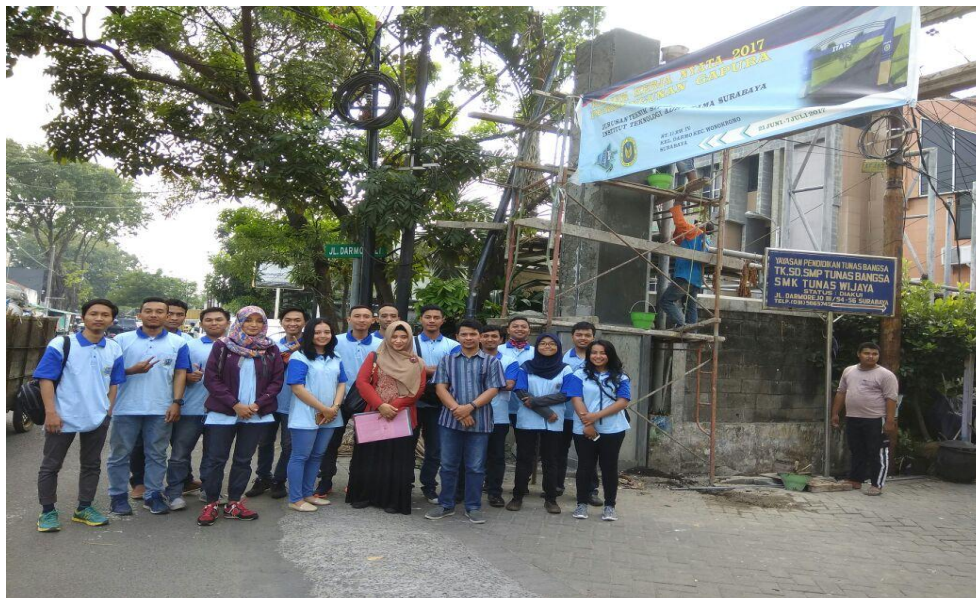
Gambar 4.6 Foto bersama di depan pembangunan gapura