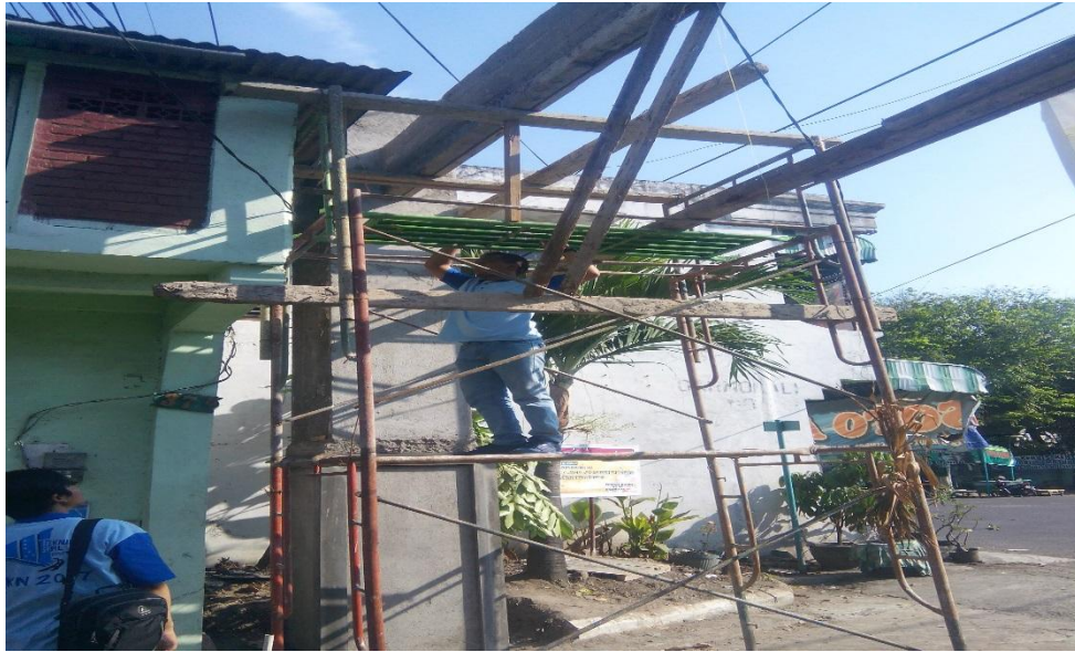
Gambar 4.3 Proses Pengecekan dimensi tiang gapura