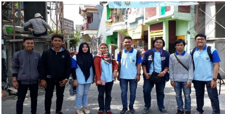
Gambar 4.1.2. View Gapura yang dibangun