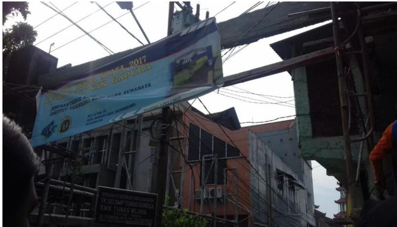
Gambar 4.1.1 Pemasangan Benner KKN