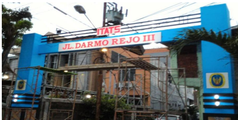
Gambar 4.1.5. Gambar Finishing Gapura