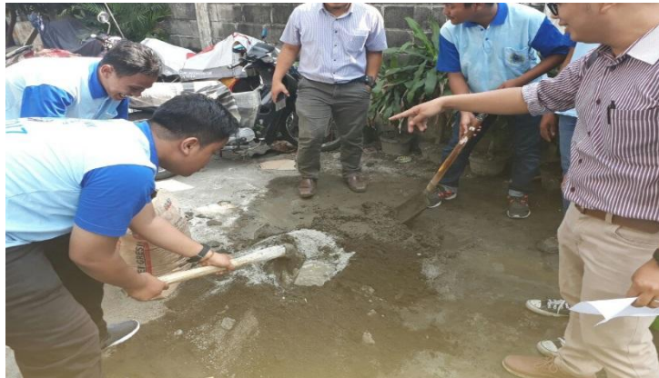
Gambar 4.3. Pembuatan Accian