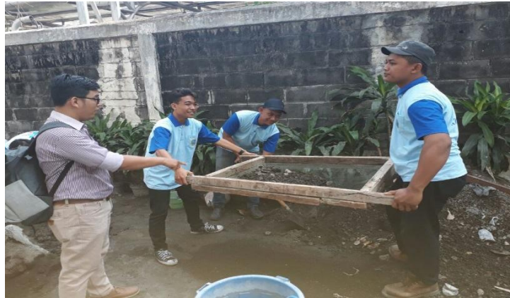
Gambar 4.2. Dokumentasi Pengayakan Agregat