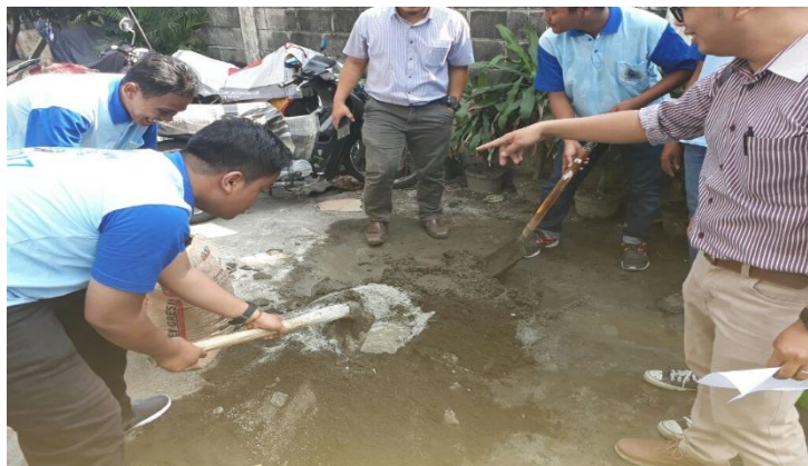
Gambar 4.3. Dokumentasi Pembuatan plesteran