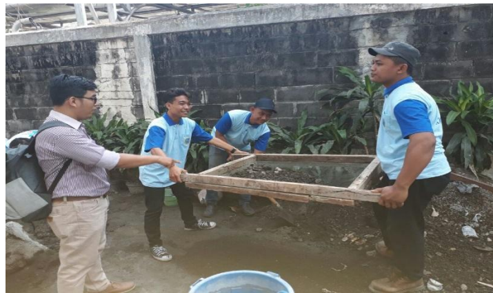
Gambar 4.2. Dokumentasi Pengayakan pasir