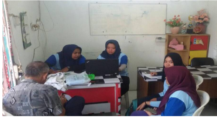
Gambar 4.1. Dokumentasi Kegiatan Pencatatan Data