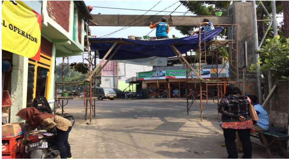
Gambar 4. 1 Pekerjaan Plesteran di Bagian Atas