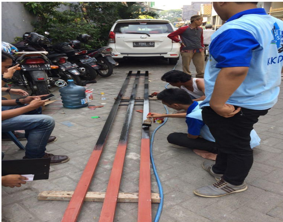
Gambar 4. 2 Pekerjaan Pengecatan Rangka Hollow Aksesoris Gapura Dilakukan 2 Orang Menggunakan Kuas dan Cat EMCO