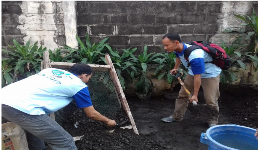
Gambar 4.5. Pekerjaan Ayakan Pasir Untuk Plesteran