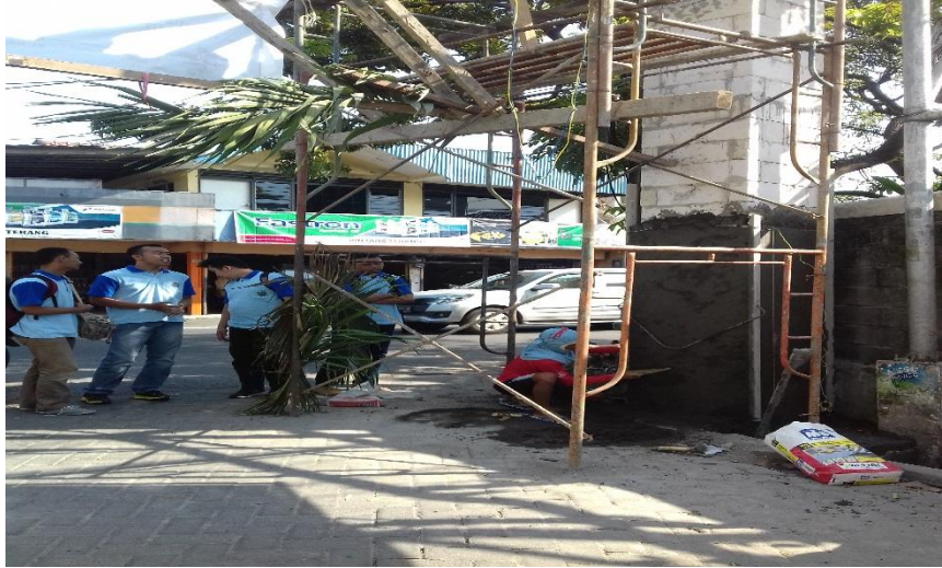
Gambar 4.4. Pekerjaan Plesteran Pembangunan Gapura