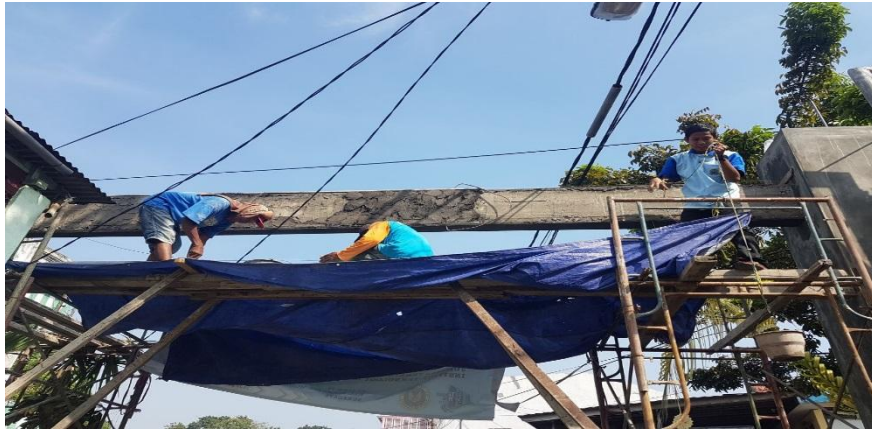
Gambar 4.2 Plesteran Gapura