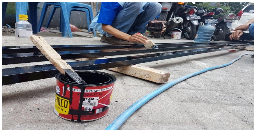
Gambar 4.3 Pengecatan Plang Nama