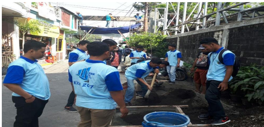
Gambar 4. 5 Pencampuran Agregat