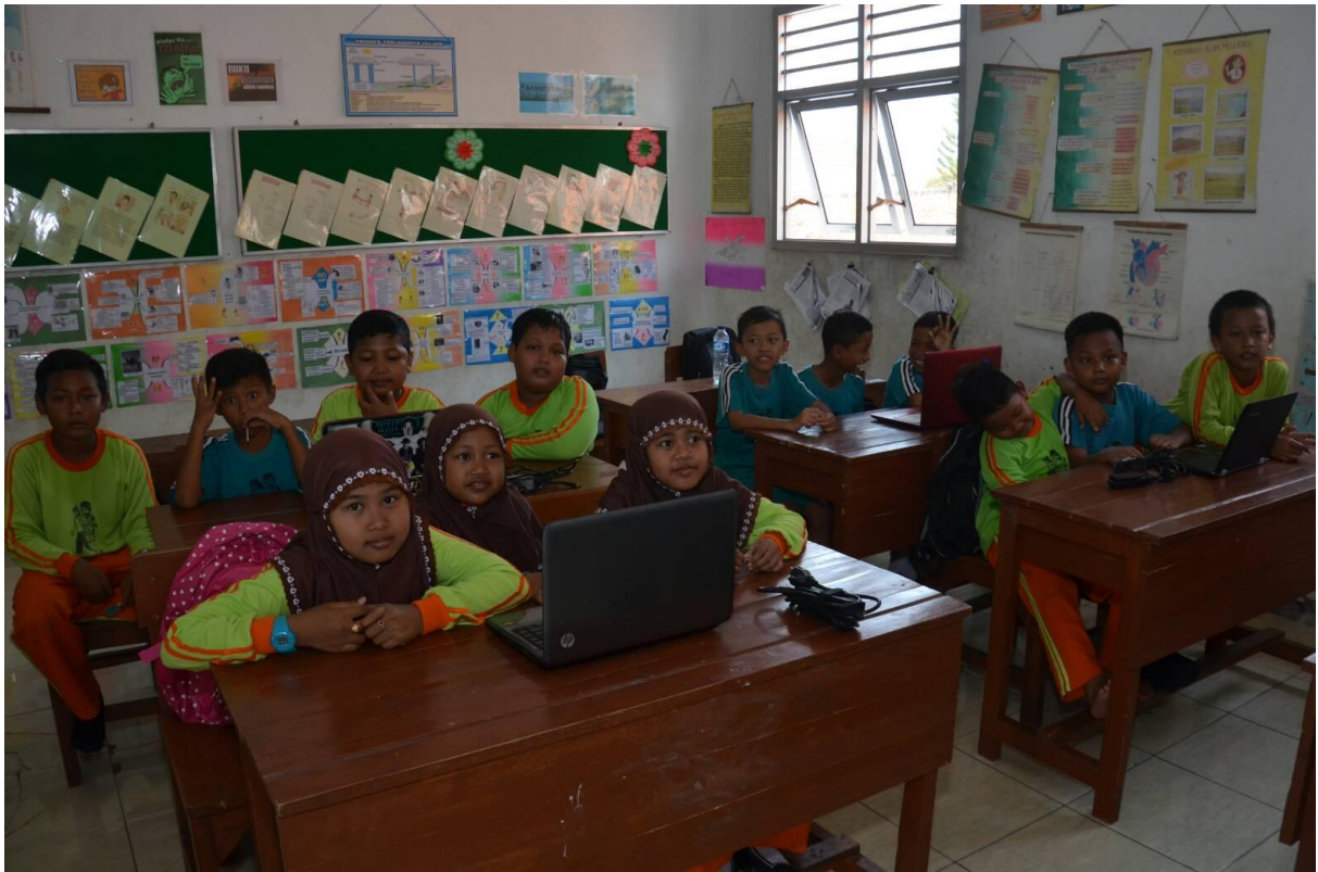
Gambar Kegiatan Pengabdian kepada Masyarakat Jurusan Teknik Industri Tahun 2017