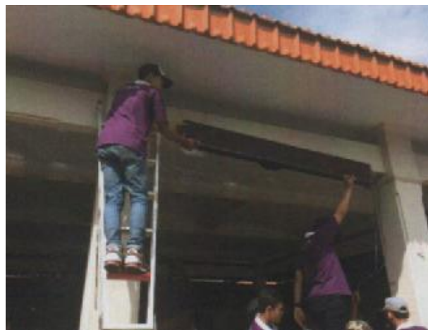
Gambar 6. Proses Perbaikan Running Text