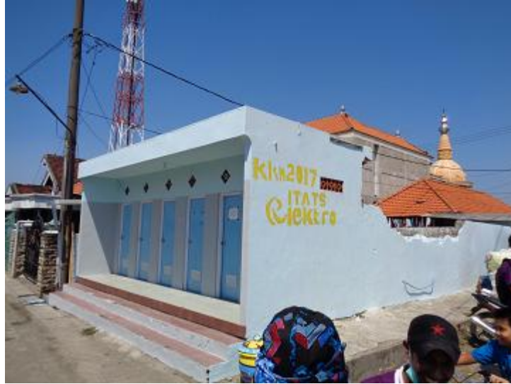
Gambar 10. Proses Perbaikan Fasilitas Umum (MCK)