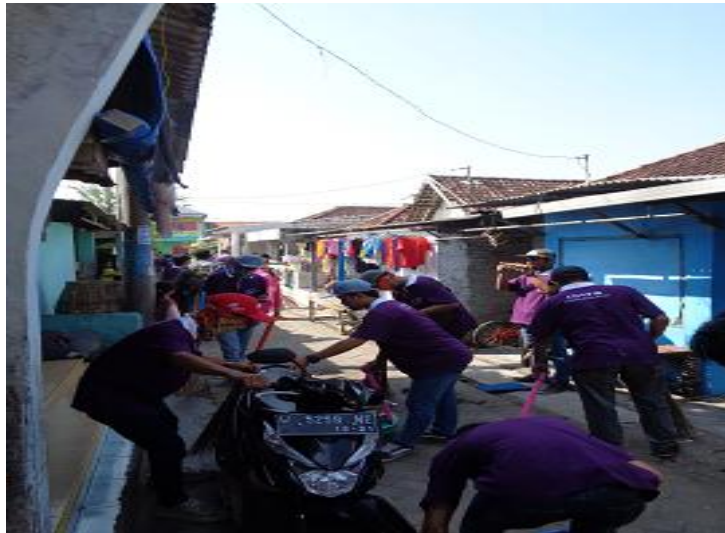
Gambar 5. Proses Acara Bersih Desa