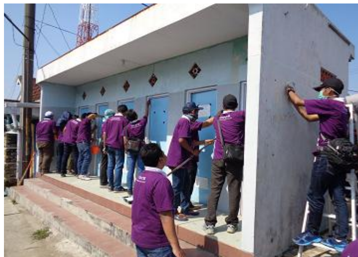
Gambar 9. Proses Perbaikan Fasilitas Umum (MCK)