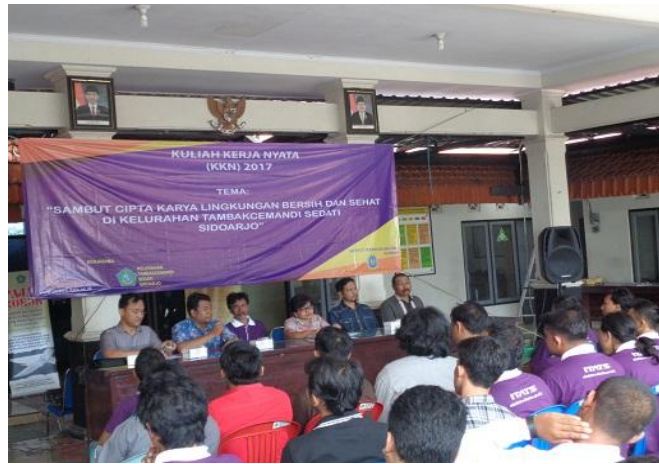
Gambar 1. Pembukaan Acara KKN-PPM Teknik Elektro 2017