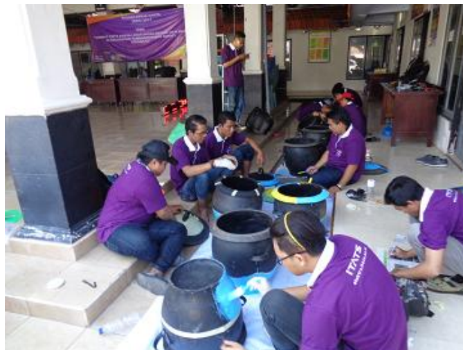
Gambar 2. Proses Pengecatan Bak Sampah