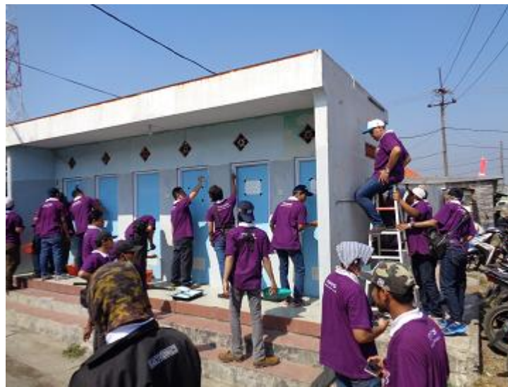
Gambar 8. Proses Perbaikan Fasilitas Umum (MCK)