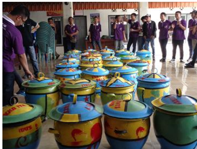
Gambar 3. Hasil Dari Tempat Sampah