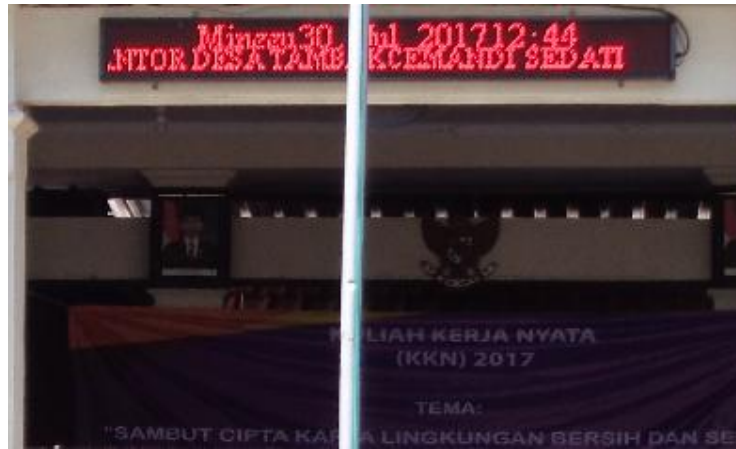
Gambar 7. Hasil Dari Perbaikan Running Text