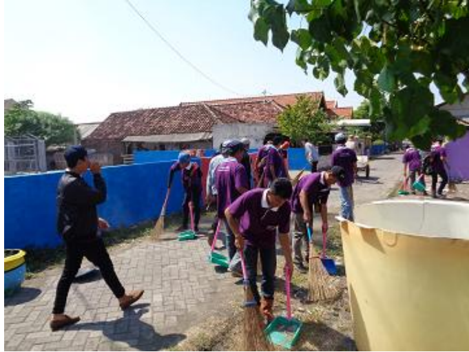
Gambar 4. Proses Acara Bersih Desa